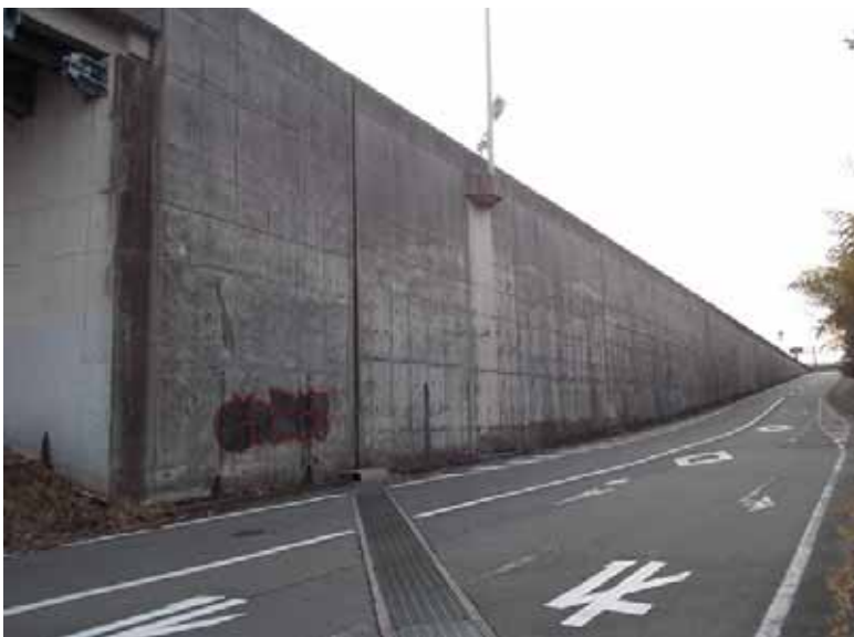
----- ----- 施工前 落書き箇所 ----- ----- ----- ----- ----- ----- ----- -----