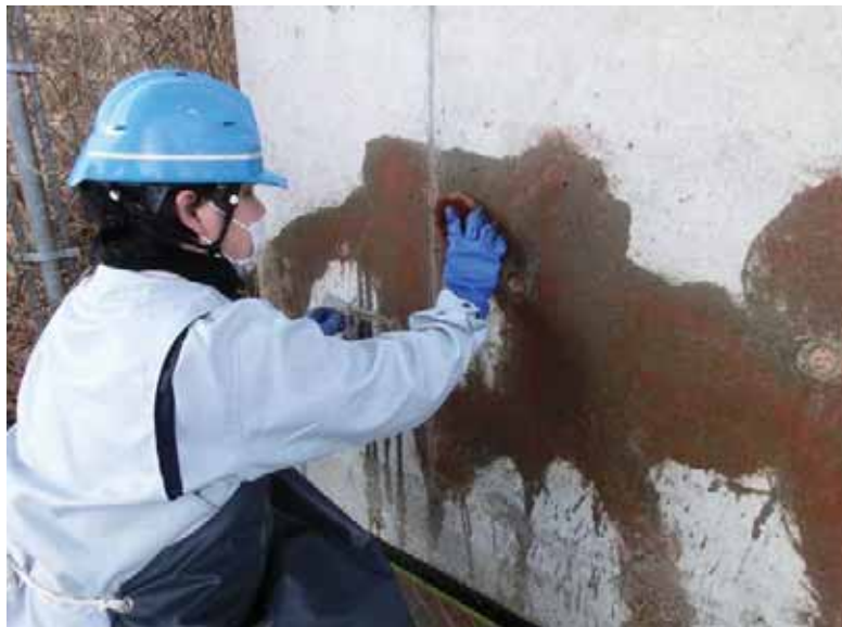
施工中 河合高架橋 橋脚 再度落書き除去剤塗布 (MT-T3)