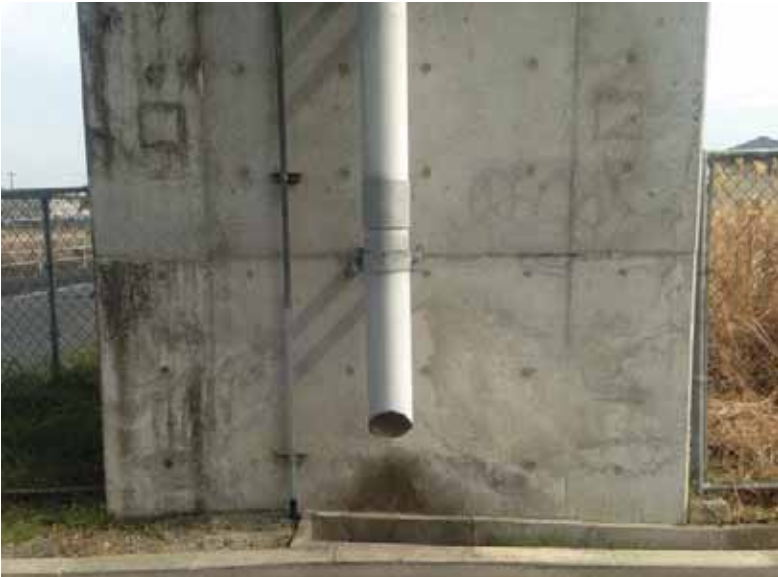
----- ----- 施工後 橋脚 ----- ----- ----- ----- ----- ----- ----- -----