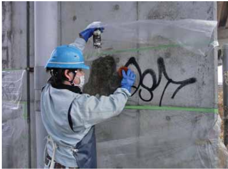
----- ----- 施工中 橋脚 落書き除去剤塗布 (MT-T3) ----- ----- ----- ----- -----