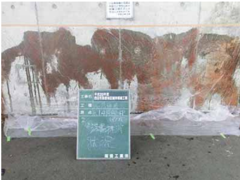
施工中 河合高架橋 橋脚 養生