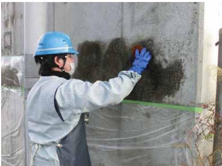
----- ----- 施工中 橋脚 再度落書き除去剤塗布 (MT-T3) ----- ----- ----- ----- -----