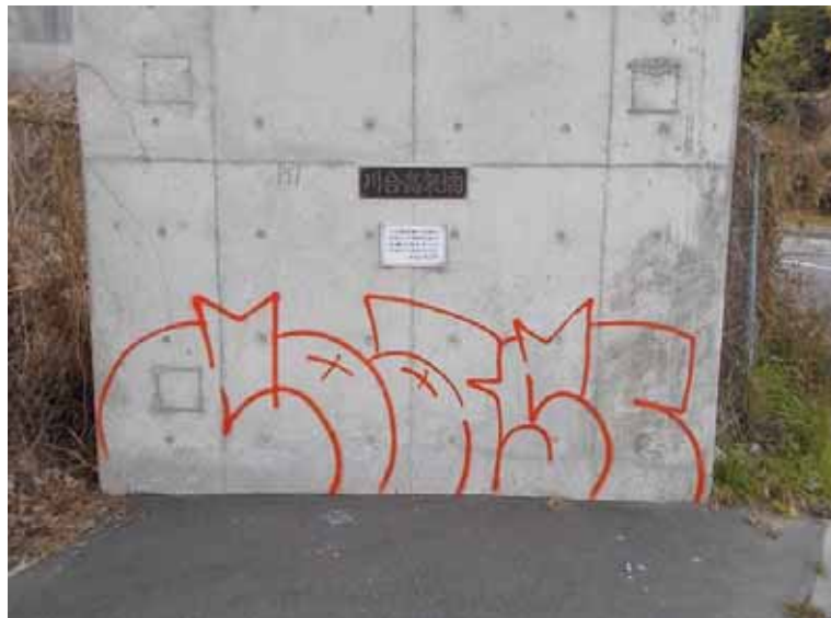
----- 施工前 川合高架橋 橋脚 -----