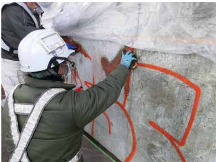
----- 施工中 河合高架橋 橋脚 落書き除去剤塗布 (MT-T3) -----