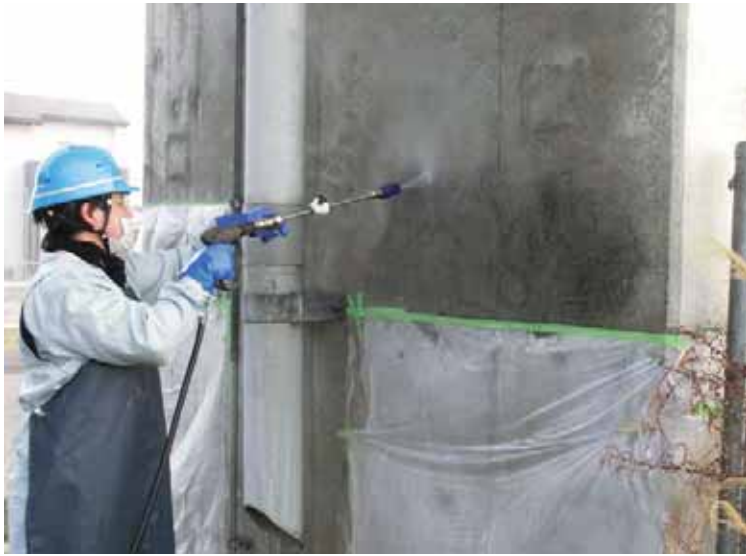
----- ----- 施工中 橋脚 ----- ----- ----- ----- ----- ----- ----- -----