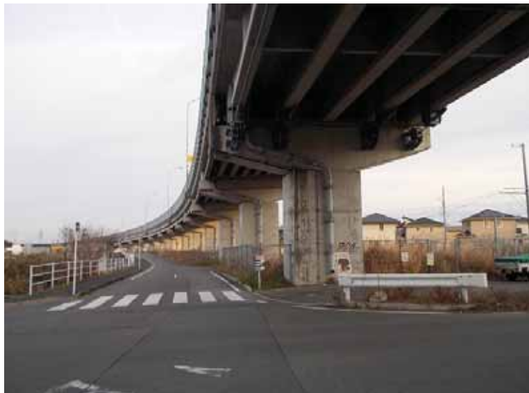
----- ----- 施工前 落書き箇所 全体風景 ----- ----- ----- ----- ----- -----