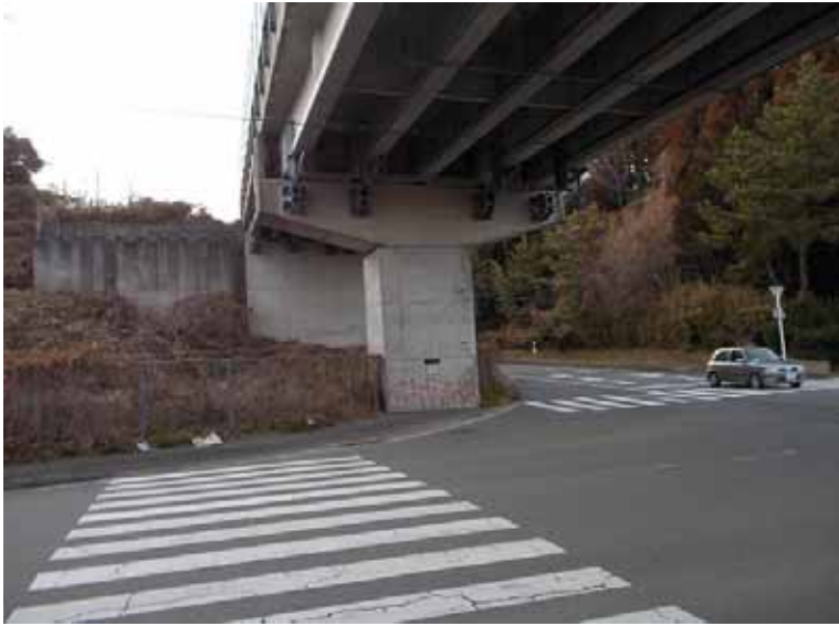
----- 施工前 河合高架橋落書き箇所 全体風景 -----