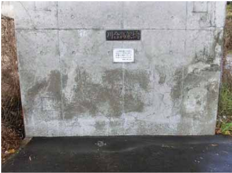
----- ----- 施工後 河合高架橋 橋脚 作業終了 ----- ----- ----- ----- ----- -----