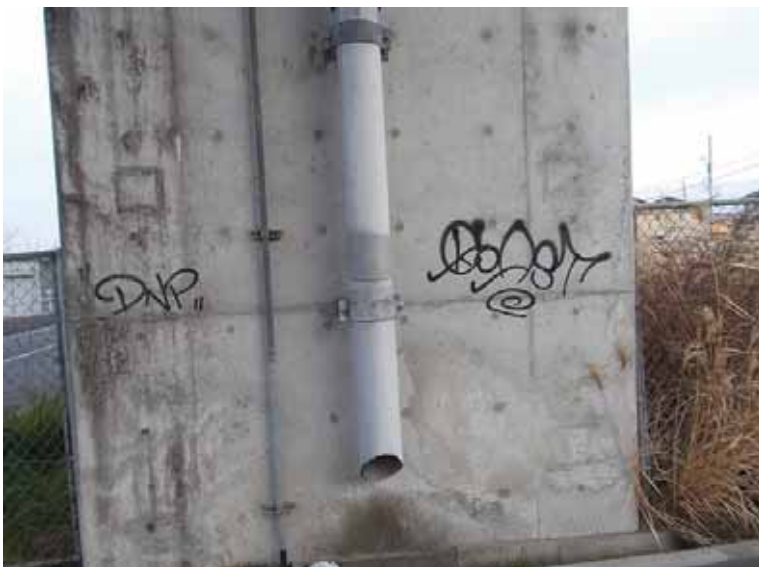
----- ----- 施工前 橋脚 ----- ----- ----- ----- ----- -----