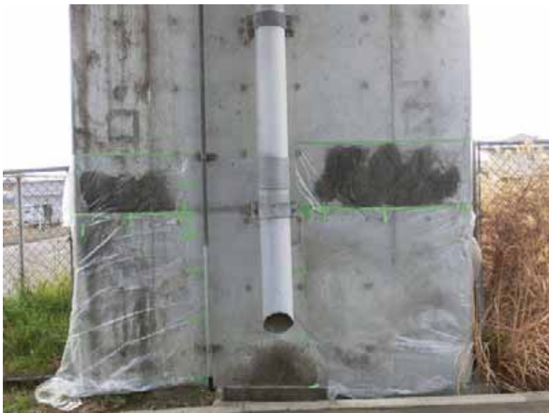
----- ----- 施工中 橋脚 養生 ----- ----- ----- ----- -----