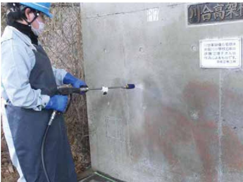
施工中 河合高架橋 橋脚 高圧洗浄機にて洗浄