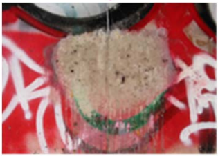
コンクリートにも！