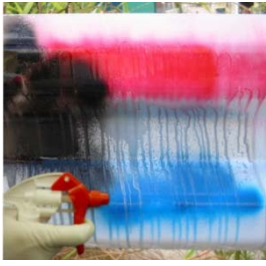
スプレーを吹きかけます