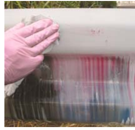
ウエス等で拭きとると・・・