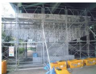
橋脚 (はり部) のASR補修事例