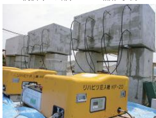
大型供試体によるASR抑制効果検証実験