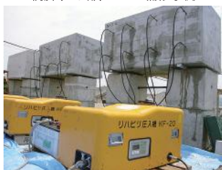
大型供試体によるASR抑制効果検証実験